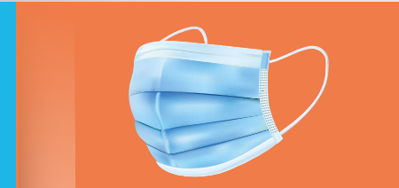
Mundnasenschutz blau oder schwarz Typ II R