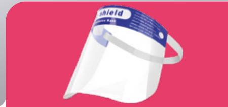
Gesichtsvisier Face Shield mit Antibeschlagschicht